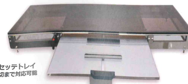
カセットトレイ 半切まで対応可能