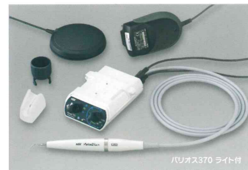
バリ奥斯370 ライト付